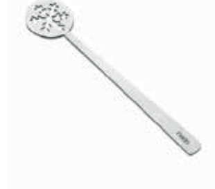
A58014.KAR - 110 mm