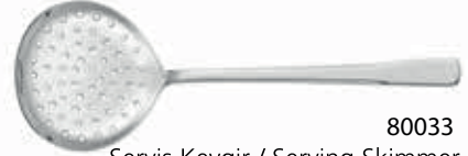
80033 Servis Kevgir / Serving Skimmer 288 mm / 3 mm