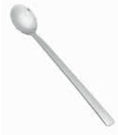
HALLEY KARIŞTIRICI KAŞIK / COFFEE SPOON