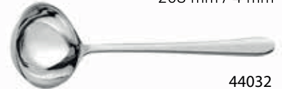
44032 Servis Kepçe / Serving Ladle 268 mm / 3 mm