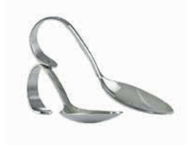
İKRAM KAŞIK / CATERING SPOON