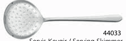
44033 Servis Kevgir / Serving Skimmer 293 mm / 3 mm