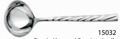
15032 Servis Kepçe / Serving Ladle 266 mm / 3 mm