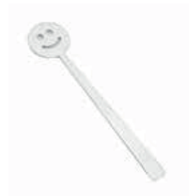
GÜLEN ÇAY KAŞIK / HAPPY TEA SPOON