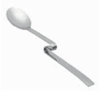
HALLEY LATTE KAŞIK / LATTE SPOON