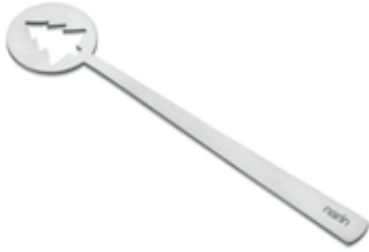
A58013.ÇAM - 110 mm