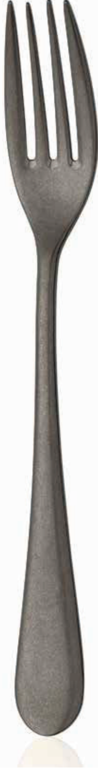
ESKİTME ANTRASİT RETRO ANTHRACITE