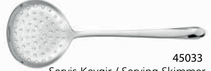
45033 Servis Kevgir / Serving Skimmer 293 mm / 3 mm