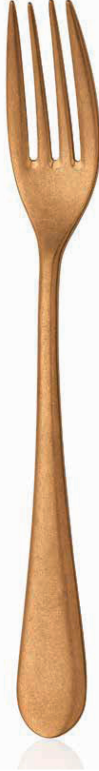
ESKİTME ALTIN RETRO GOLD