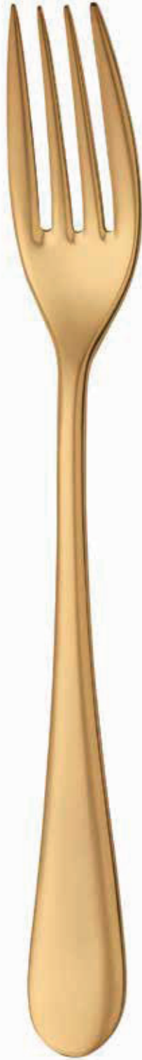
KOMPLE MAT ALTIN FULL SATIN GOLD