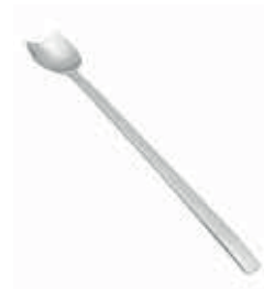
HALLEY KOKTEYL KAŞIK / COCTAIL SPOON