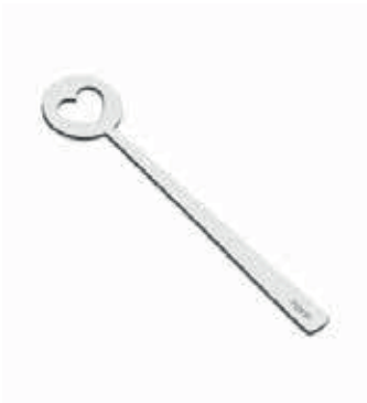
A58015.KALP - 110 mm