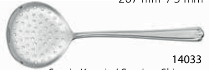
14033 Servis Kevgir / Serving Skimmer 290 mm / 3 mm