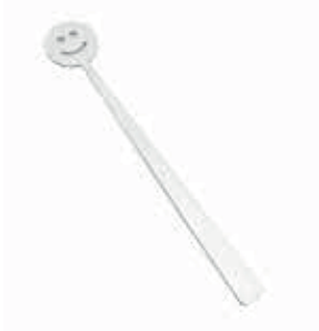
GÜLEN KUPA KAŞIK / HAPPY COFFEE SPOON