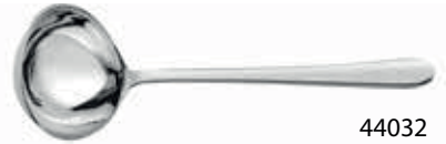
44032 Servis Kepçe / Serving Ladle 268 mm / 3 mm