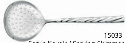
15033 Servis Kevgir / Serving Skimmer 288 mm / 3 mm