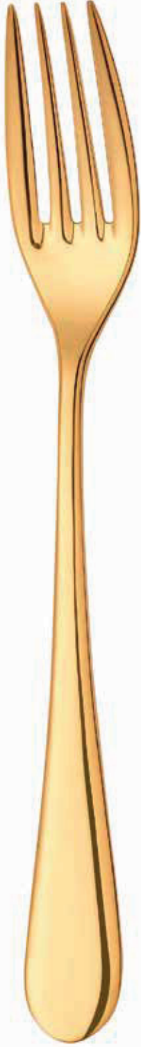
KOMPLE ALTIN FULL GOLD