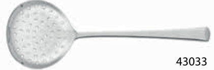
43033 Servis Kevgir / Serving Skimmer 291 mm / 3 mm