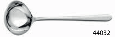
44032 Servis Kepçe / Serving Ladle 268 mm / 3 mm