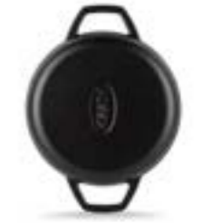
HS Y KTV 22 SH

Ürün Adı : Çift Kulplu Sahan 16 / 19 / 22 Cm.