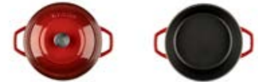
HS Y DT 20

Ürün Adı : Derin Tencere 20 / 24 / 28 Cm. Sığ Tencere 28 Cm.