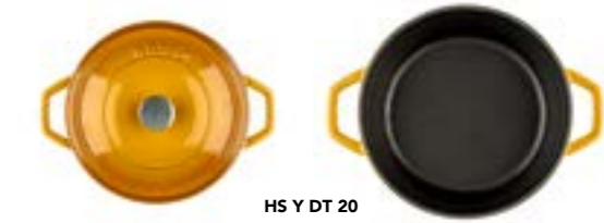
HS Y DT 20

Ürün Adı : Derin Tencere 20 / 24 / 28 Cm. Siğ Tencere 28 Cm.