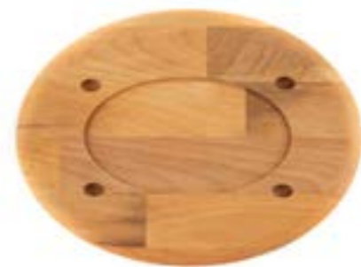
HS O İSK 1728