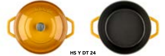
HS Y DT 24