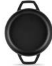
HS Y KTV 19 SH