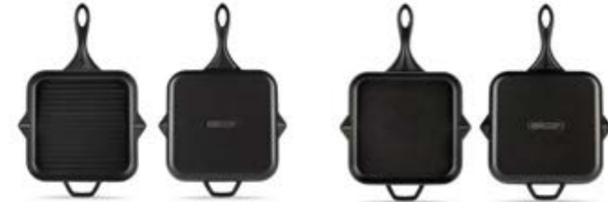
HS Y GTV 28