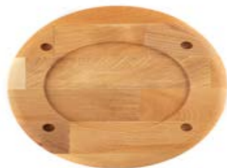
HS O İSK 2533