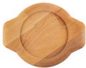
HS Y KTV 16 SH