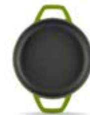
HS Y KTV 22 SH