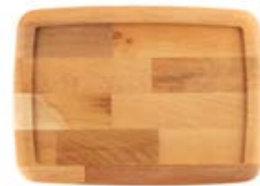
HS ST 2131