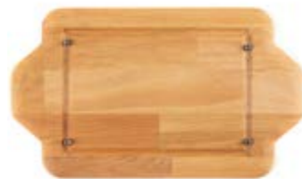
HS DD HP 1522