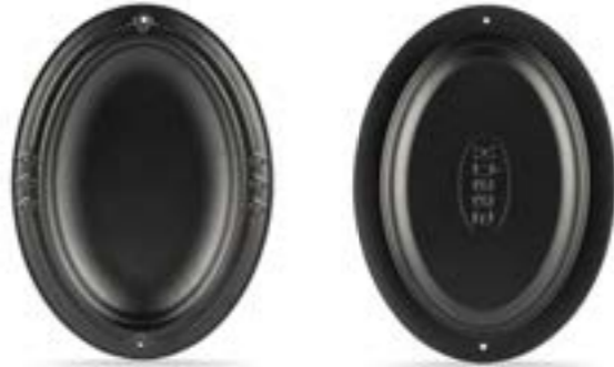
HS O İSK 2533