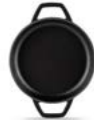
HS Y KTV 16 SH