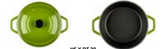
HS Y DT 20

Ürün Adı : Derin Tencere 20 / 24 / 28 Cm. Siğ Tencere 28 Cm.