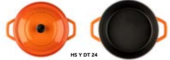
HS Y DT 24