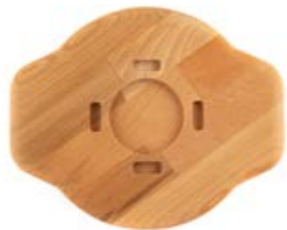
HS Y SAK 20