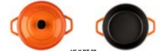
HS Y DT 20

Ürün Adı : Derin Tencere 20 / 24 / 28 Cm. Siğ Tencere 28 Cm.