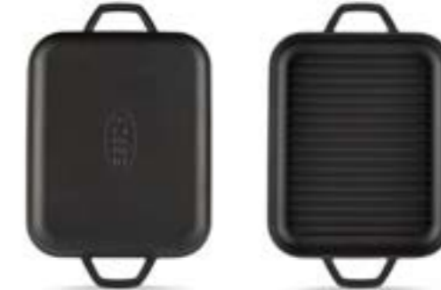
HS DD GTV 2632

Ürün Adı : Dikdörtgen Izgara Tavası ve Fırın Kabı 26 x 32 Cm.