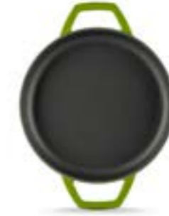
HS Y KTV 16 SH