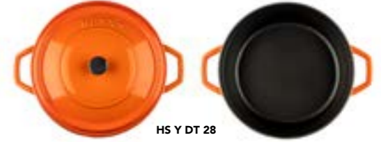
HS Y DT 28