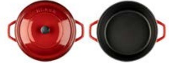
HS Y DT 28