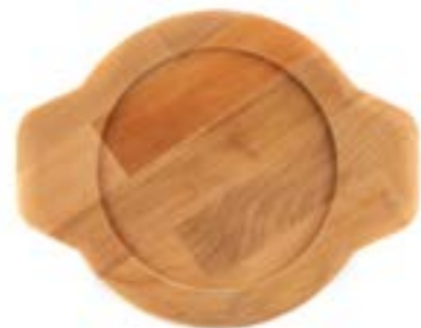
HS Y KTV 19 SH