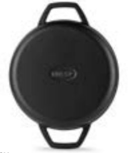
HS Y KTV 16 SH