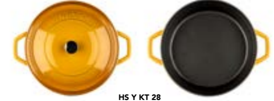
HS Y KT 28