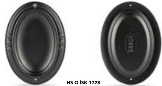
HS O İSK 1728

Ürün Adı : Oval İskender Tabağı 17 x 28 Cm. / 25 x 33 Cm.