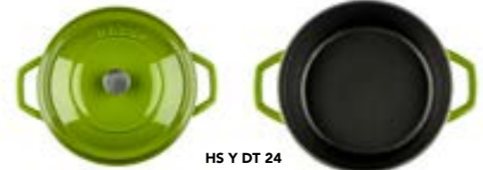
HS Y DT 24