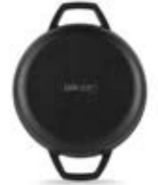
HS Y KTV 19 SH