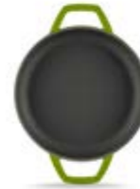
HS Y KTV 19 SH