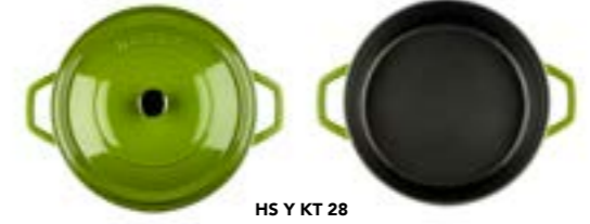
HS Y KT 28