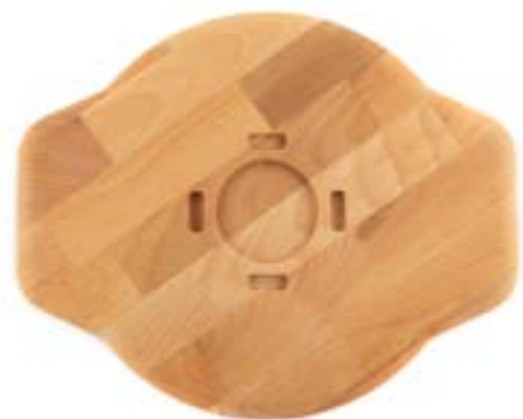
HS Y SAK 28