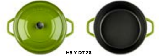
HS Y DT 28