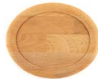
HS FT 1825