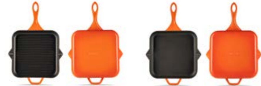
HS Y GTV 28